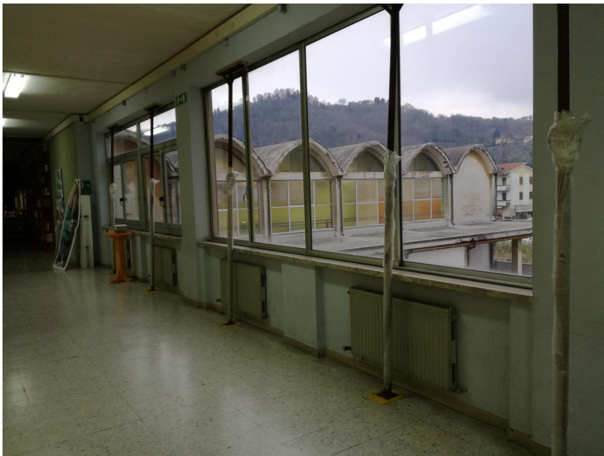
Corridoio piano primo