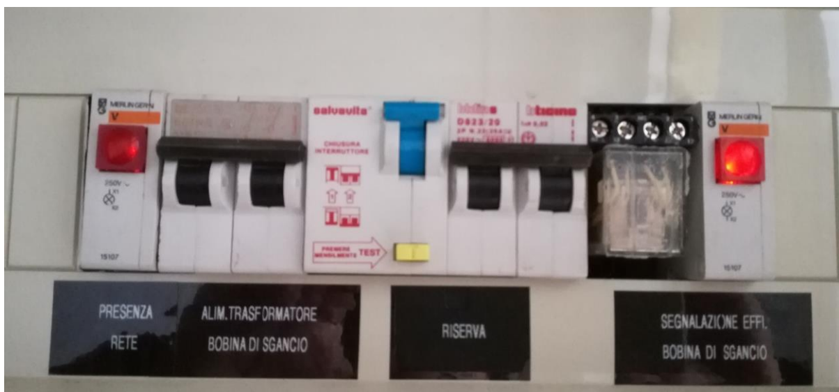
Quadro elettrico generale