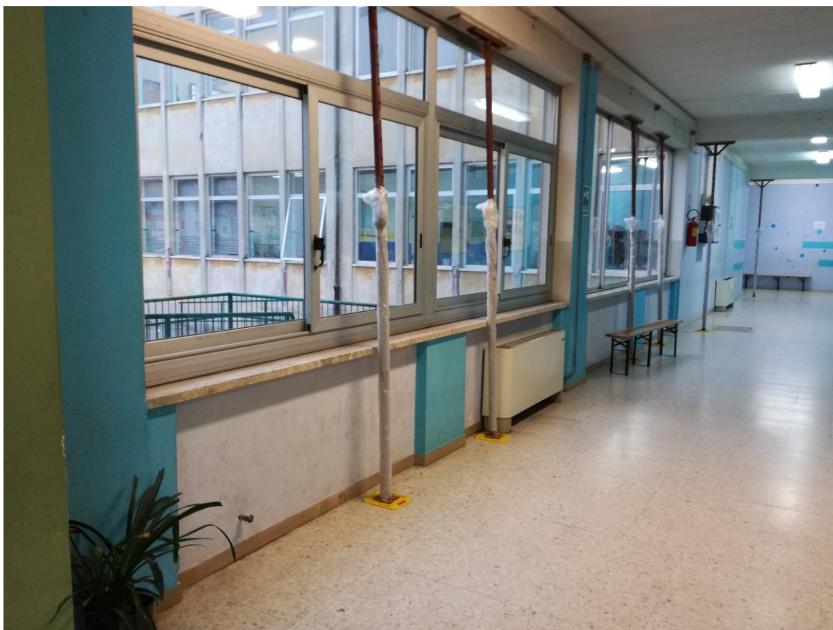
Corridoio piano terra