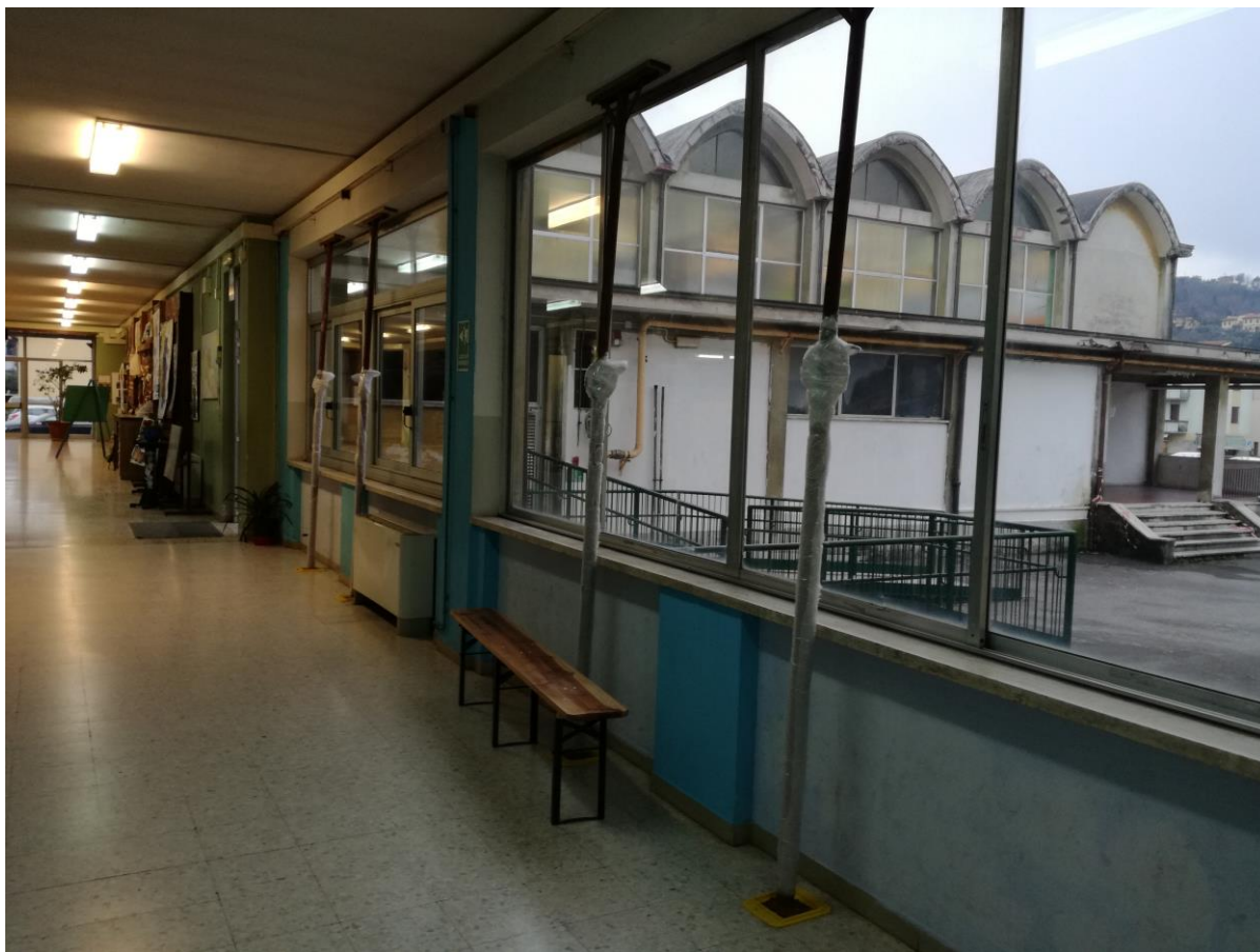
Corridoio piano terra