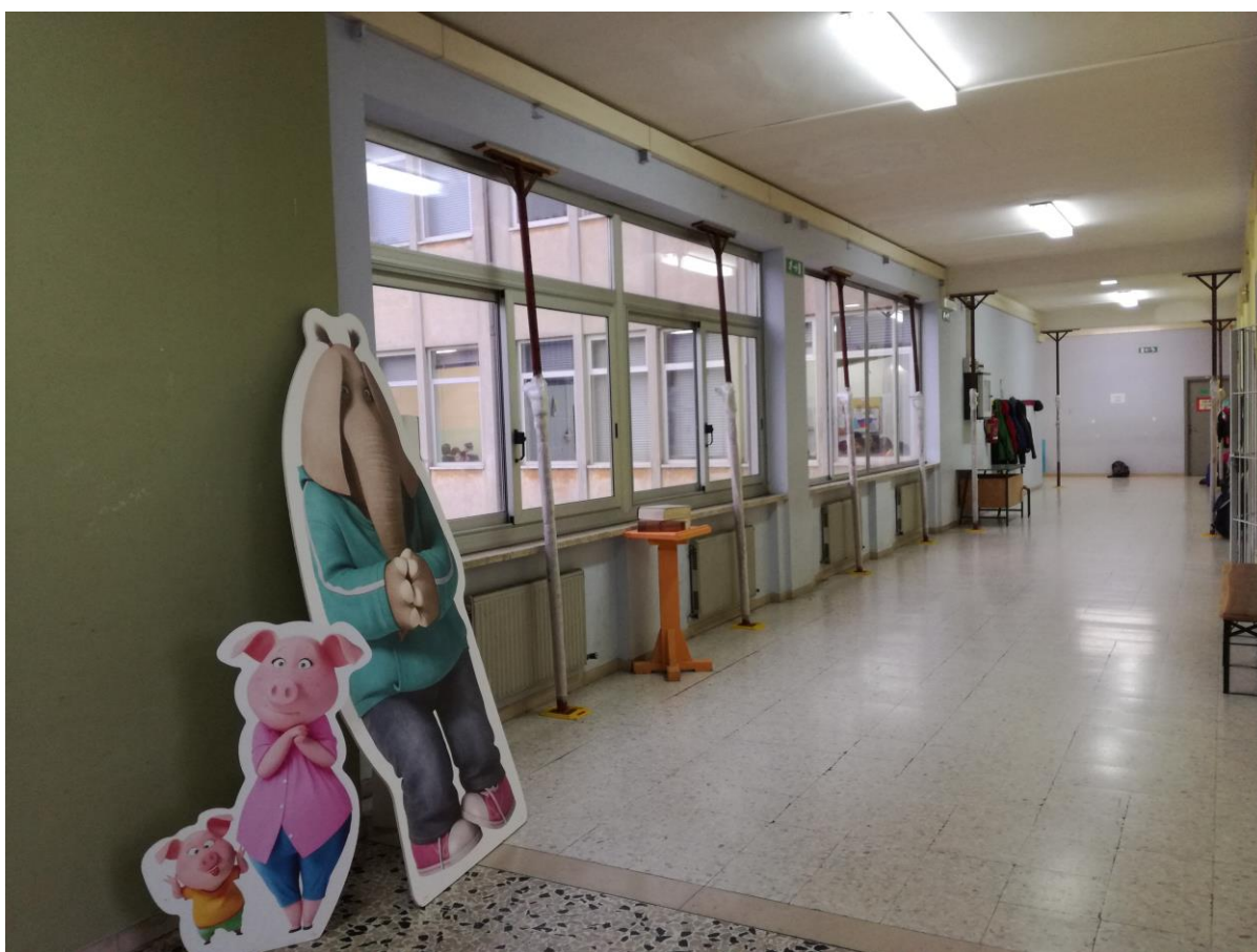
Corridoio piano primo