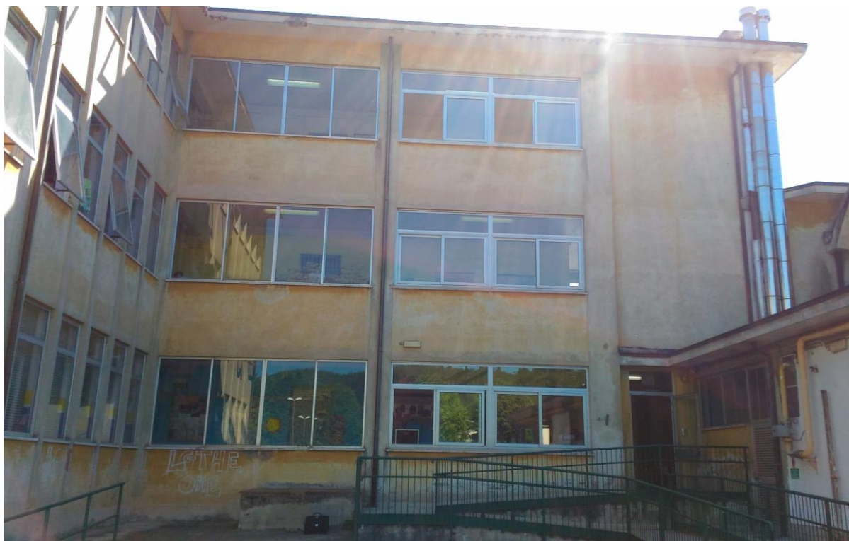
Vista dal piazzale