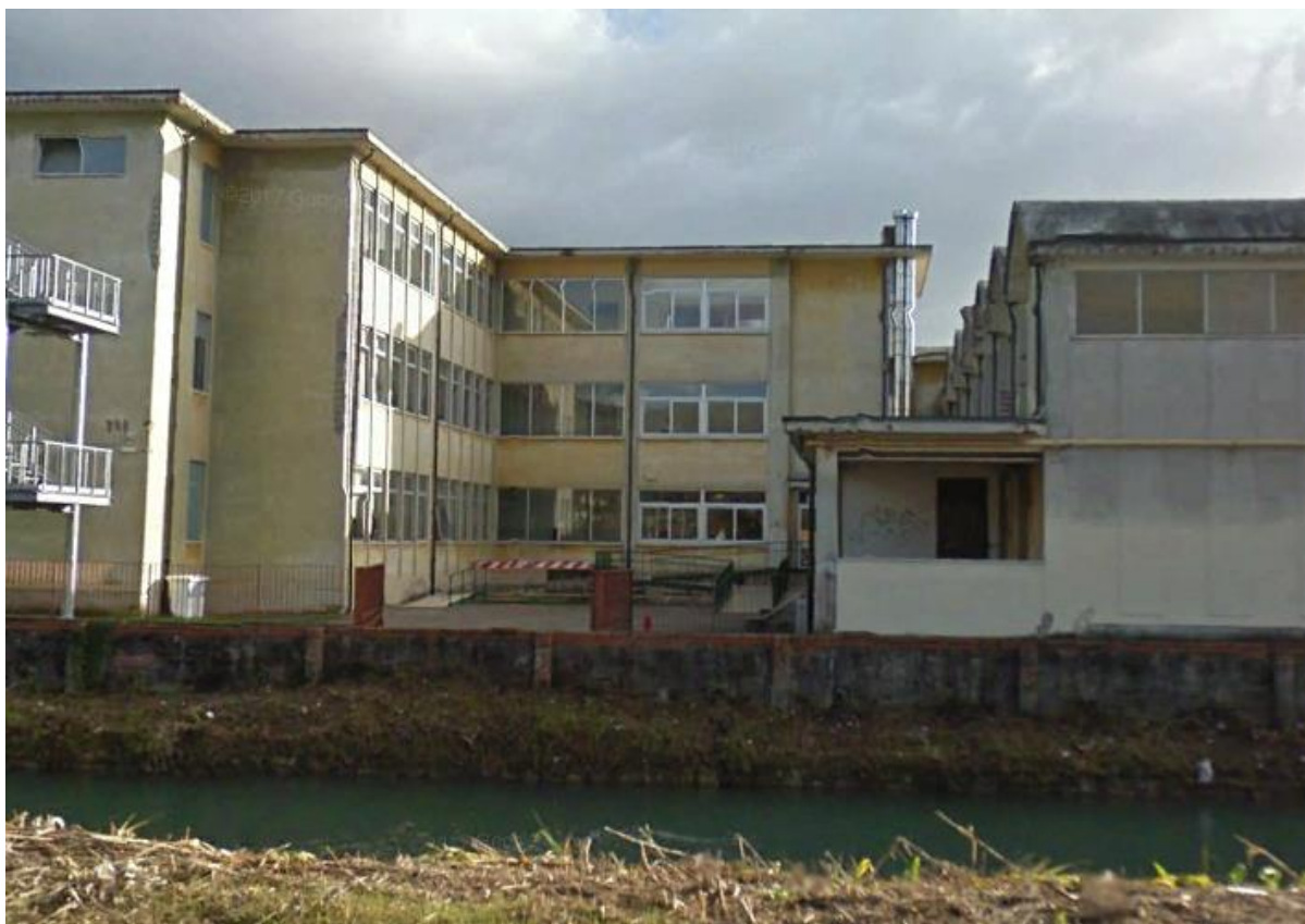
Vista dal parcheggio