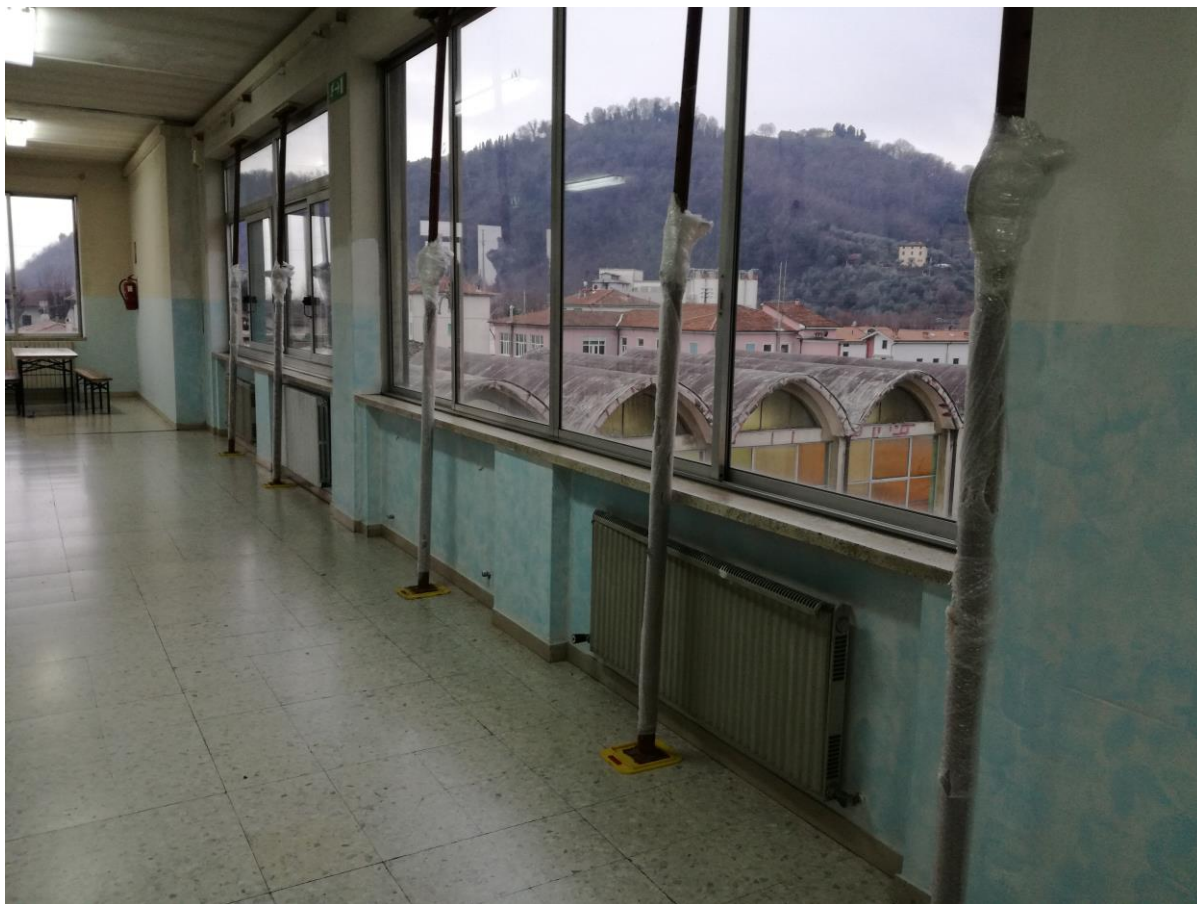
Corridoio piano secondo