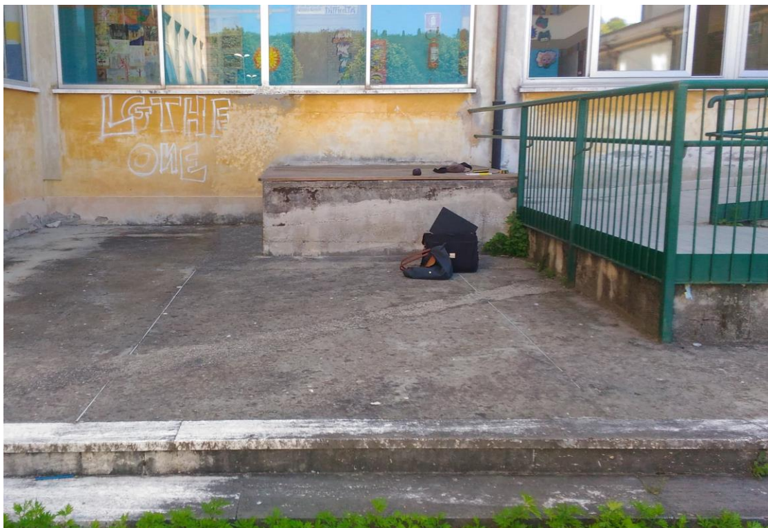
Vista vasca attuale