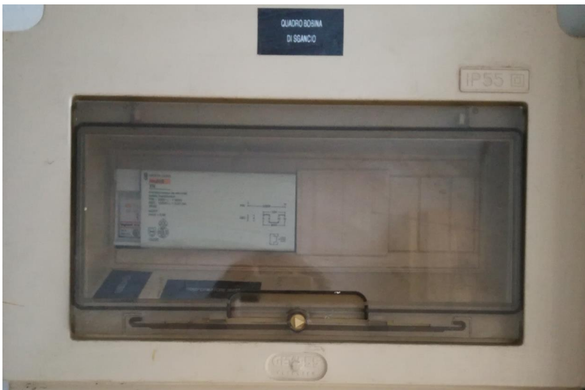
Quadro elettrico generale