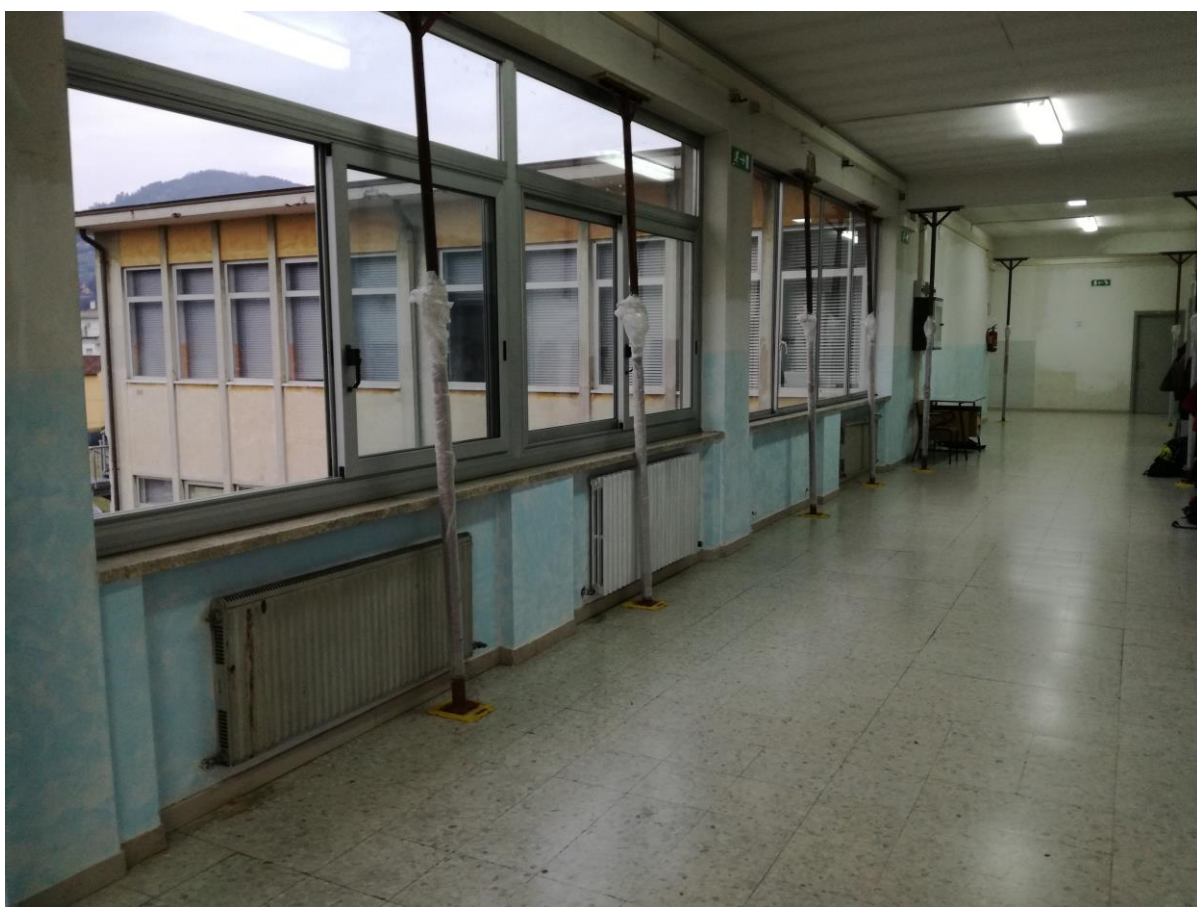
Corridoio piano secondo